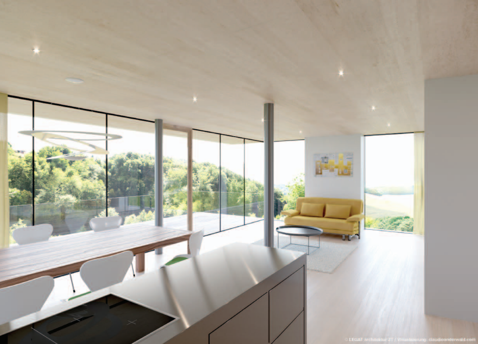
AUSBLICK - LICHTEIFALL - RAUMATMOSPHERE