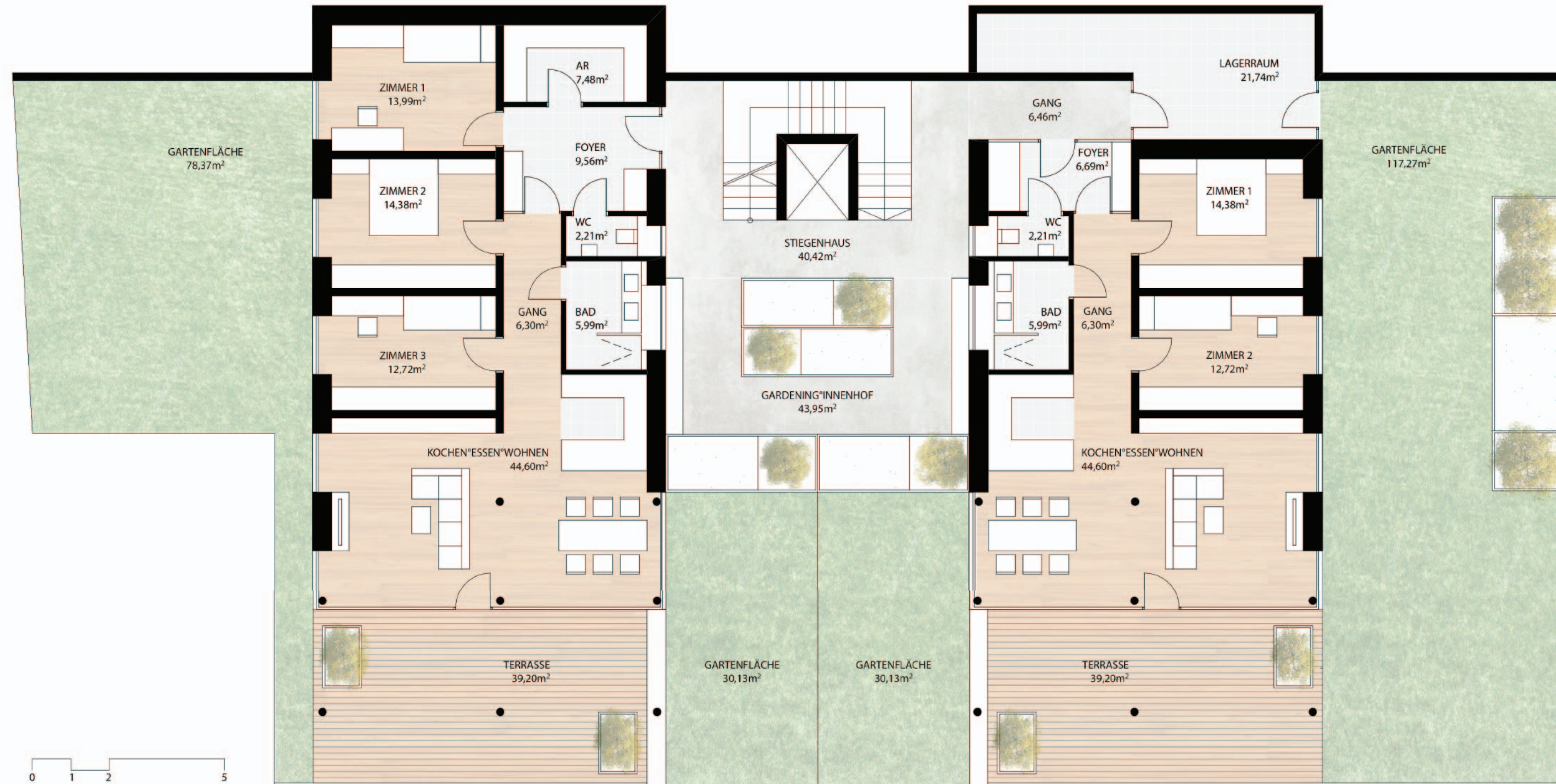
GRUNDRISS TYP 1